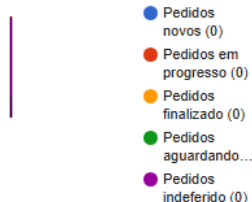
Atividade da Ouvidoria Pública Municipal - ESTATÍSTICAS GERAIS